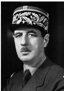
Le général de Gaulle

Que savez-vous de ces protagonistes après avoir travaillé sur la chronologie ?