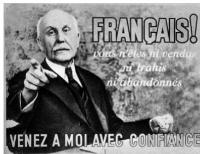
Le maréchal Pétain